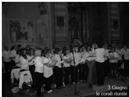
3 Giugno le corali riunite